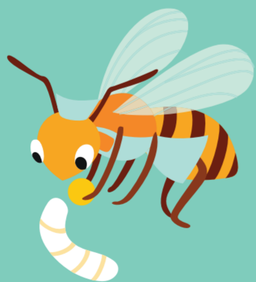
Jours 3-11 Nourrice