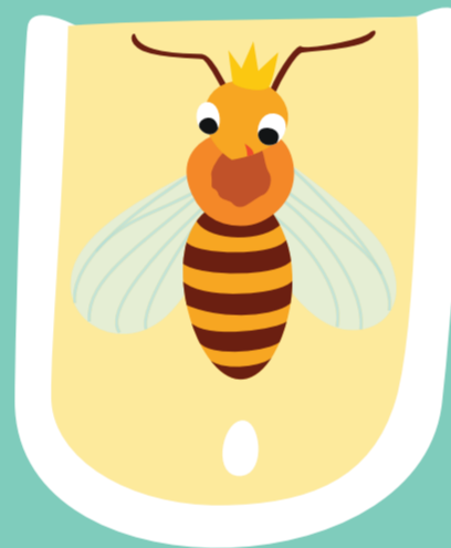
0-3 jours Oeuf