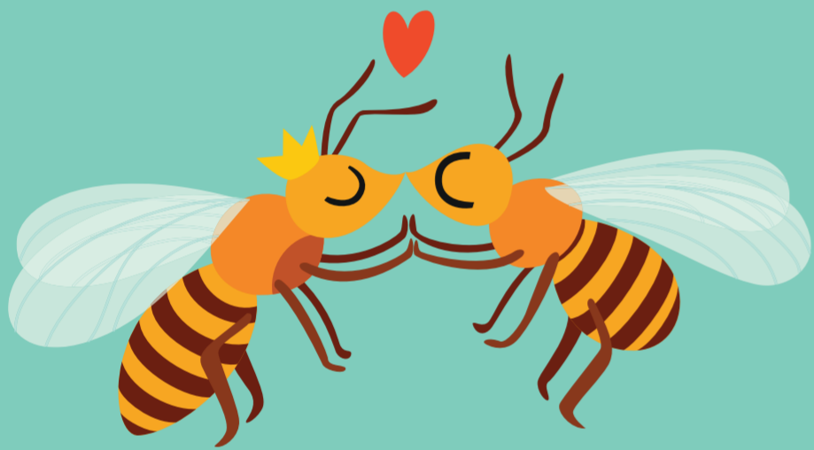
Reine et Faux-Bourdon