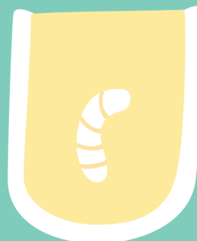
4-10 jours Larve