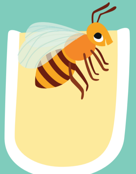
21 jours Abeille