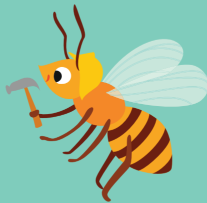
Jours 12-17 Bâtisseuse