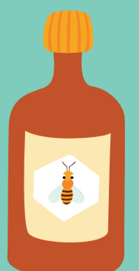
et la propolis.