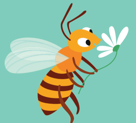
Jour 22 Butineuse

L'abeille mange le nectar des fleurs et boit de l'eau. En hiver, elle mange le nectar transformé en miel.