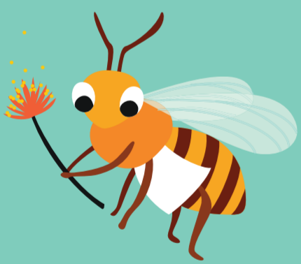
Jours 1-2 Nettoyeuse