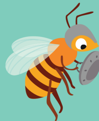
Jours 18-21 Gardiennne