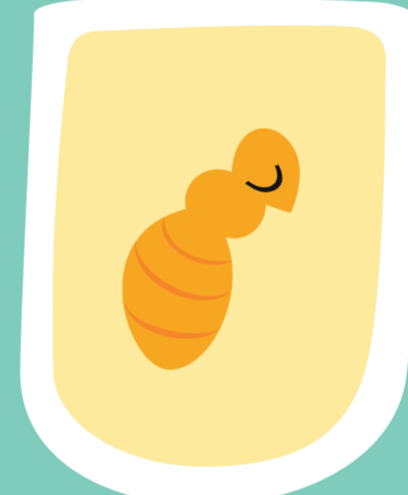
11-20 jours Nympe